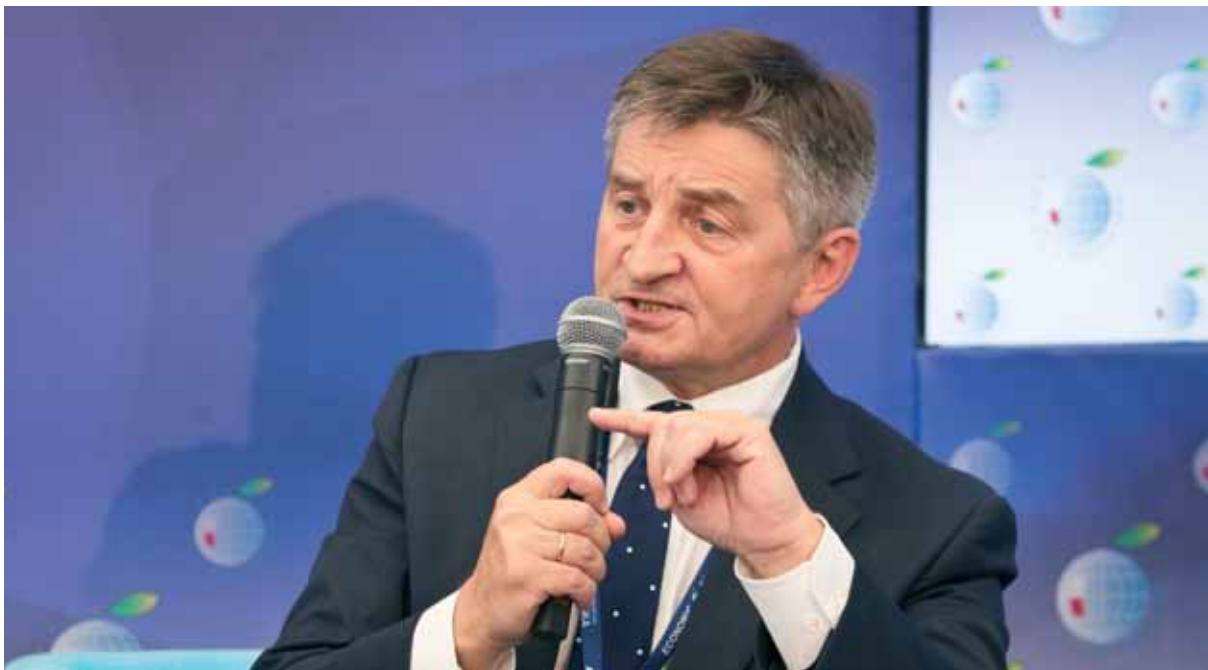
Marek Kuchciński, Marszałek Sejmu Rzeczypospolitej Polskiej