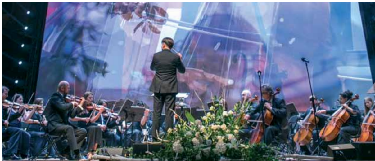
Orkiestra Sinfonietta Cracovia pod batutą Jurka Dybały