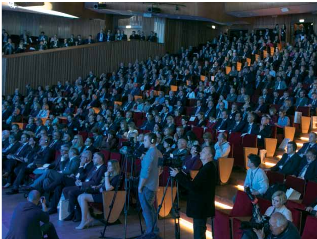
Goście Europejskiego Kongresu Samorządów

Rola instytucji finansowych we wdrażaniu środków unijnych, praktyczne rozwiązania dla samorządów i ochrony zdrowia, współpraca między biznesem a nauką oraz zarządzanie jednostkami kultury to główne tematy dyskusji podczas II Europejskiego Kongresu Samorządów. Ważną kwestią poruszoną podczas obrad był także problem rewitalizacji. Rewitalizacja to nie tylko remonty zniszczonych budynków, dróg czy tworzenie terenów zielonych. To także rozwiązywanie problemów społecznych: bezrobocia, przestępczości, wykluczenia społecznego. Chodzi o poprawę życia mieszkańców, pobudzenie ich aktywności i przedsiębiorczości - mówił prof. Zygmunt Ziobrowski z Instytutu Rozwoju Miast podczas panelu „ Rewitalizacja: fenomen lokalny, czy globalna moda? Czy samorządy stać na rewitalizację? ”.