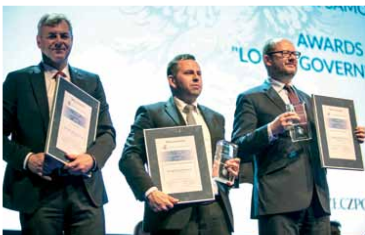
Laureaci Konkursu „Lider Samorządu 2015”

Od niemal 20 lat redakcja „Rzeczpospolitej” systematycznie opisuje rozwój samorządów w Polsce, co roku ogłaszając prestiżowy Ranking Samorządów. Wśród kandydatów pod uwagę brani są wójtowie, burmistrzowie i prezydenci, którzy mogli pochwalić się najlepszymi wynikami ekonomicznymi, ocenianymi na podstawie danych Ministerstwa Finansów i Głównego Urzędu Statystycznego oraz najlepszym wykorzystaniem środków z Unii Europejskiej.