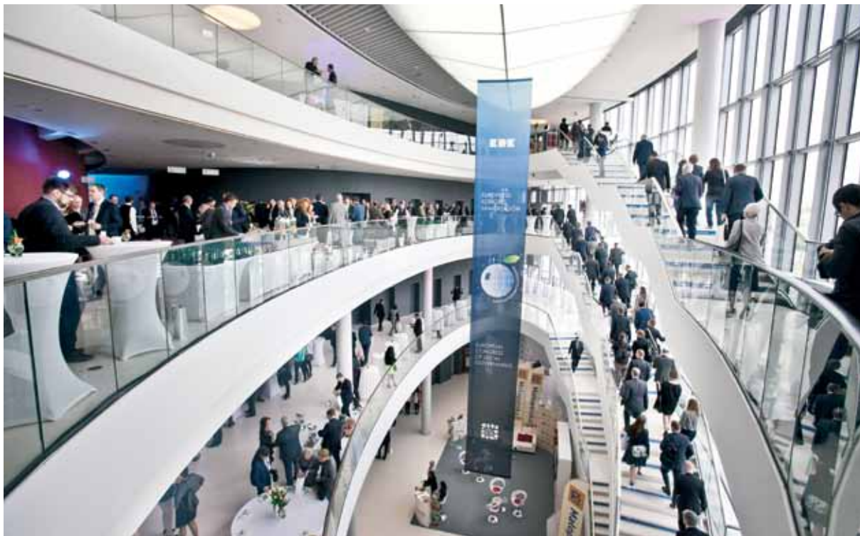
Centrum Kongresowe ICE Kraków