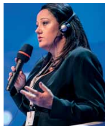
Lilyana Pavlova , Minister, Ministerstwo Rozwoju Regionalnego, Bułgaria